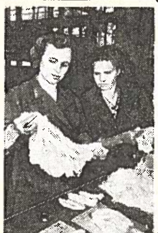
Leningrado dirbtinio pluošto gamyboje išleisti pirmieji naujo sintetinio pluošto iš polivinilinio spirito — vinilono pavyzdžiai.

Nedidelė, skurdžiai apstregusi mergytė pamėmė nuo suolo ryšulėlį, sustojo. Nebylus jos žvilgsnis atsiveikinda-