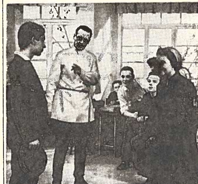
Kadras iš naujo, Kijevo kinostudijos išleisto filmo, — „Vėliavos bokštuose“. Filmas sukurtas pagal to paties pavadinimo Makarenkos kūrinį, jo veiksmas vyksta 1930 metais, kai Makarenka vadovavo F. Dzeržinskio vardo vaikų komunai.