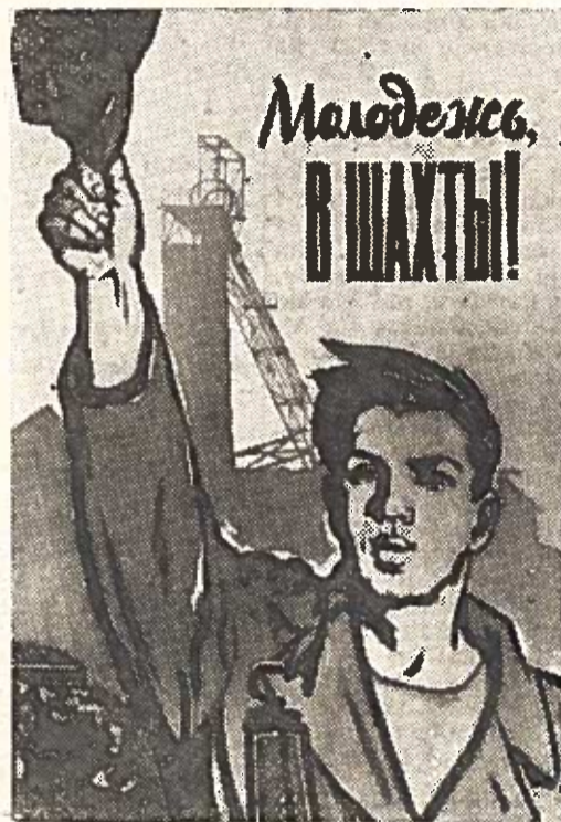
„Jaunime, į šachtas!“ Daillninko J. Solovjovo (Valskybinė vaizduojamojo meno leidykla) plakatas.