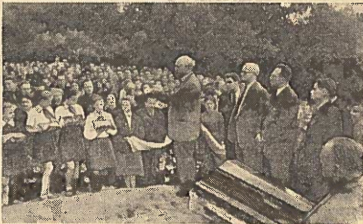
Gedulo mitingas prie A. Žukausko-Vienuoelio kapo. Kalba Lietuvos TSR Aukščiausiosios Tarybos Prezidiumo pirmininkas J. Paleckis.

Antanas Žukauskas-Vienuoelis 1882.IV.7.— 1957.VIII.17., skendi gyvoje gelėse, vainikuose.