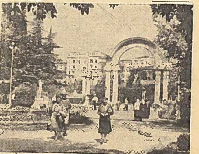
GRUŽIJS TSR Tarybinės valdybos metais plačiai išsivystė balneologinis kurortas Čchaltubo. Čia pastatyta puikios vonios, sanatorijos, komfortiškas viešbutis. Aplinkui išsidėstę skverai ir parkai. Iki revoliucijos čia vienu metu galėjo gydytis 130 žmonių. Jie gyveno mediniuose namuose. Šio metu kurortas turi 14 sanatorių su 2950 vietų. Nuotraukoje: įėjimas į centrinį Čchaltubo parką.