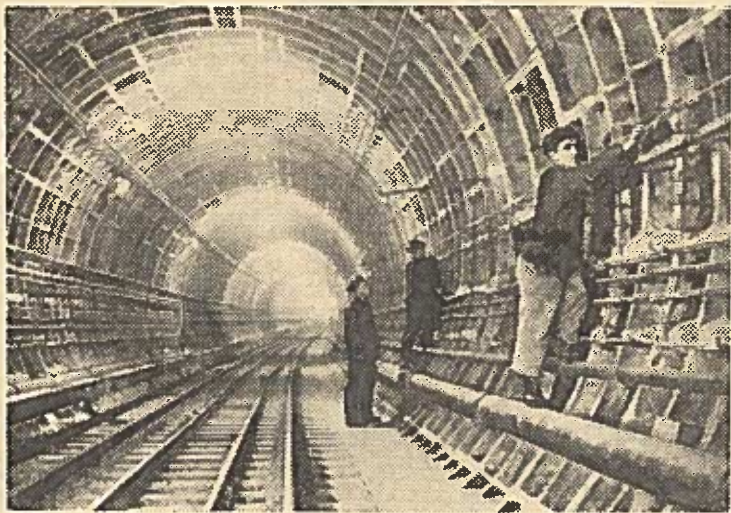
Nuotraukose: (kairėje) elektromontavimo darbai vienoje iš tunelio stacybų tarp „Frunzės“ ir „Usačiovo“ stotyų; (dešinėje) naujoje „Frunzės“ stotyje.