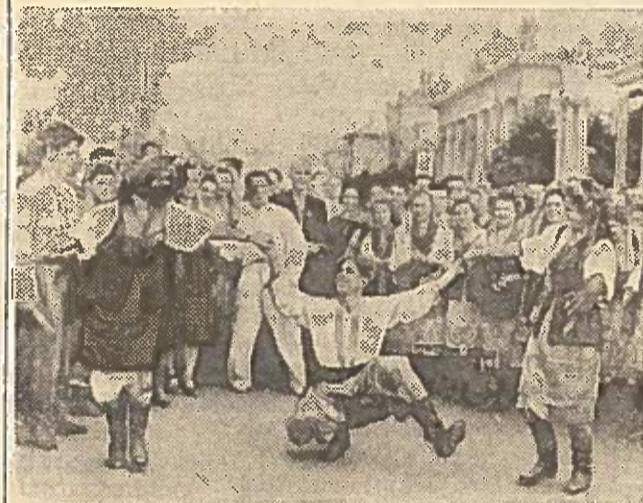
Nuotraukoje: festivalio svečiai — Charkovo miesto statybininkai.

Maskviečių dėmesio centre ir toliau lieka draugiškos jaunimo sporto žaidynės. Lengvaatlečių varžybos, pasibaigusios rugpjūčio 4 d., buvo masiškiausios III tarptautinių draugiškų jaunimo sporto žaidynių programoje. Jose dalyvavo 74 sportininkės ir 243 sportininkai iš daugelio pasaulio šalių. Varžybų metų buvo pa-