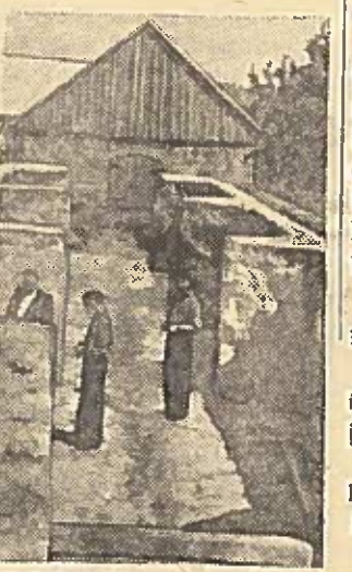
Kalvarijos rajono kolūkiuose statomi silosavimo įrenginiai. Nuotraukoje: naujas siloso įrenginys „Taikos“ kolūkyje.