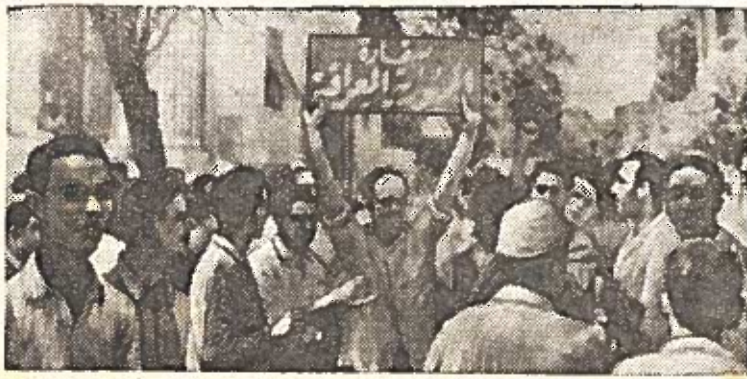
Prieš Irako respublikos pasiuntinybę Kaire (Jungtinė Arabų Respublika) irakiečiai ir jordaniečiai studentai išreiškia savo džiaugsmą, paskelbus Irako respubliką. Ant transporto užrašas: „Irako respublika“