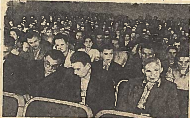
Korespondentų suvažiavimo posėdžių salės bendras vaizdas.