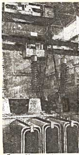
Zaporožės transformatorių gamykla baigė surinkti pirmąjį transformatorių tipo TDNG 40500/132. Transformatoriaus galingumas 40500 kilovoltamperų.

„Socializmo keliu“ kolūkyje dirba 65 m. amžiaus kalvis Kulikauskas. Jo knygutėje už 1957 metus — virš 600 darbdienių. A. Jakštas