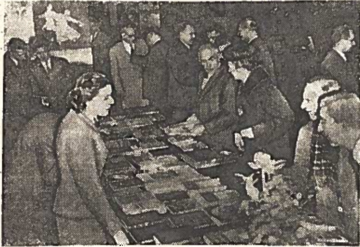
★ ŠVEICARIJA. Ženevoje atidaryta paroda „TSRS 1957 metais“. Parodą organizavo draugija „Šveicarija — TSRS“.

★ Nuotraukoje: lankytojai apžiūri knygas ir žurnalus, išleistus Tarybų Sąjungoje užsienio kalbomis.