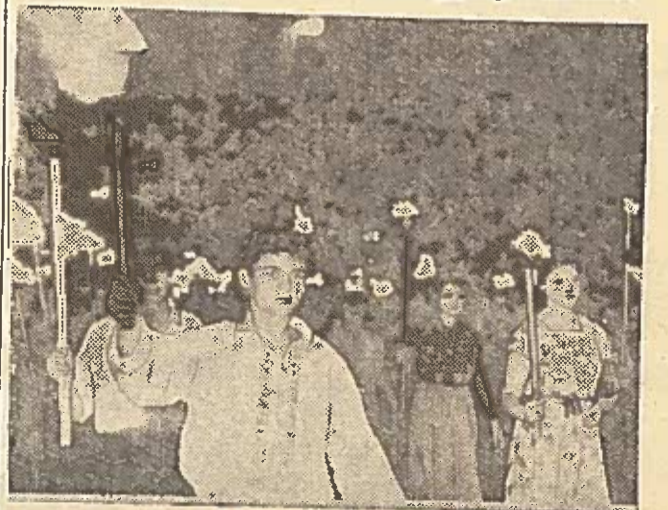
Nuotraukoje: tradicinė festivalio dalyvių eiseną su fakelais.