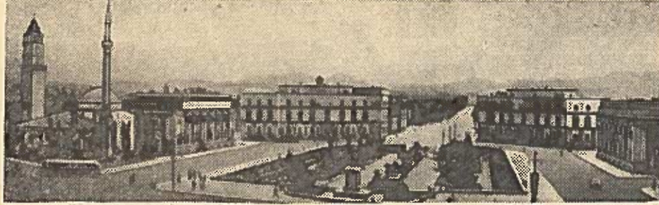
TIRANA. Skanderbego vardo aikštė.