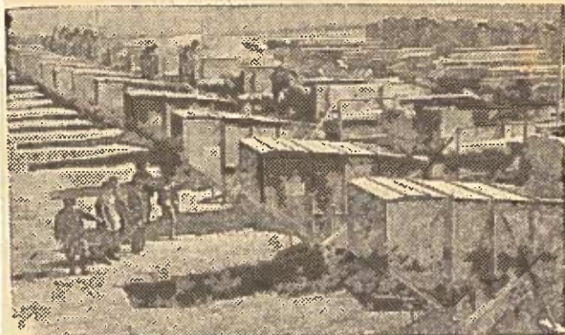
DAGESTANO ATSR. Respublikos MTS parkai nuolat pasipildo naujais žemės ūkio technika.

Nuotraukoje: nauji kombainai Manasko MTS teritorijoje.