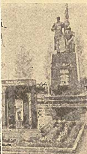
Tulos sritis. Netoli nuo Šėkino rajono Pervomaisko darbininkų gyvenvietės — pastatytas paminklas tarybiniam kariams, kritusiems kovoje su vokiškais okupantais.

Dauguma mitingo dalyvių ilgais plojimais karštai pritarė V. Kapsukui. Paskui Kapsukas kalbėjosi su atskirais mitingo dalyviais, atsa-