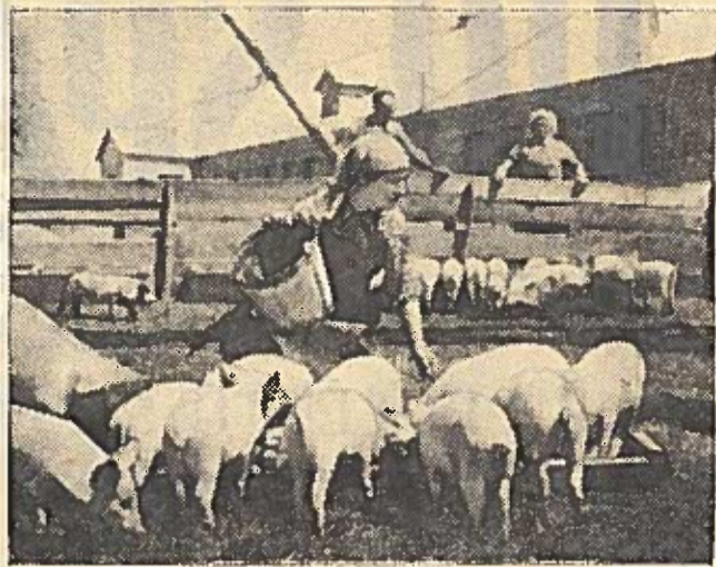
Vilkaviškio rajono Komjaunimo vardo kolūkis per pirmuosius penkis šių metų mėnesius šimtui hektarų arimo gavo po 21 centnerį kiaulienos. Dabar penima 800 kiaulių. Šiemet kiekvienam šimtui hektarų ariamos žemės bus pagaminta po 70 centnerių kiaulienos.

Nuo traukoje: geriausiaji kiaulininkė Stasė Darmavičiūtė, išauginusi iš kiekvienos jai priskirtų 11 kiaulių po 12,5 parselio ir jau nupenėjusi 75 bekonus.