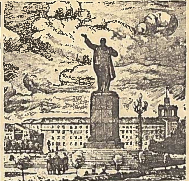
Vilnius. LĒNINO PAMINKLAS

Vilnius — respublikos aukštųjų mokyklų centras. Čia mokosi daugiau