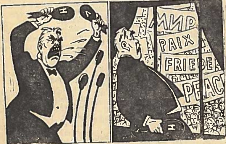
Nors ir balsus velnias...