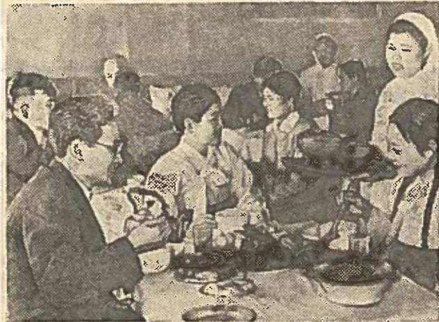
Korėjos Liaudies Demokratinėje Respublikoje dirba daug sanatorijų ir poilsio namų. Nuotraukoje: Vonsanio poilsio namų valgykloje.