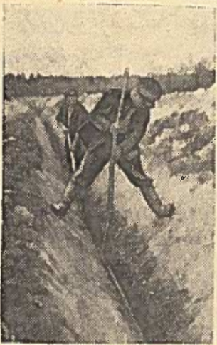
Radviliškio rajone atliekami dideli darbai nusausinant ir įsavinant pelkėtą ir labai drėgną žemę.

Vien tik Černiachovskio vardo kolūkyje jau sukultūrinta pievoms ir ganykloms 280 hektarų. Dabar čia kasami magistraliniai, surenkamieji kanalai, tiesiamas uždaras drenažas 80 hektarų plote.