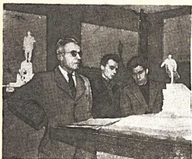
MASKVA. Šusevo vardo rusų architektūros muziejaus salėse atidaryta konkursinių V. I. Lenino paminklo Maskvoje projektų paroda. Konkursumi atsiųsta daugiau kaip 130 projektų.

Tačiau visa tai nedaug tepadedo žvalgybinių centrų ponams. Jų rezidentai, nežiaurint į technikos stebuklus, rapestingą išdresiravimą ir milžiniškas išlaidas, vienas po kito žlunga. Šnipai „dega“, sutikdami socialistinių šalių gyventojų budrumą. Nei milijonai dolerių, nei naujausia aparatūra nepadės jiems įveikti šią nenugalimą sieną.