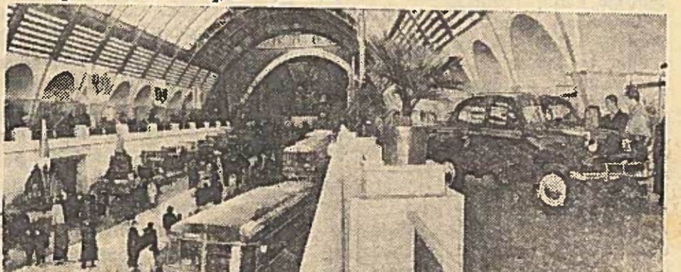
Nuotraukose: (kairėje) bendras parodos vaizdas, (dešinėje) mašinų statybos paviljone.