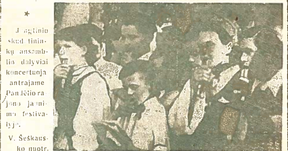
Reportažą apie Pandėlio rajono antrąjį jaunimo festivalį skaitykite 4 puslapyje.

— Štai šiandien festivalyje dainuoja Obelių jungtinis pusantro šimto žmonių choras, dalyvauja apie pus-trėčio šimto obeliečių. Skamba jų balsai, plazda jų vėliavos.