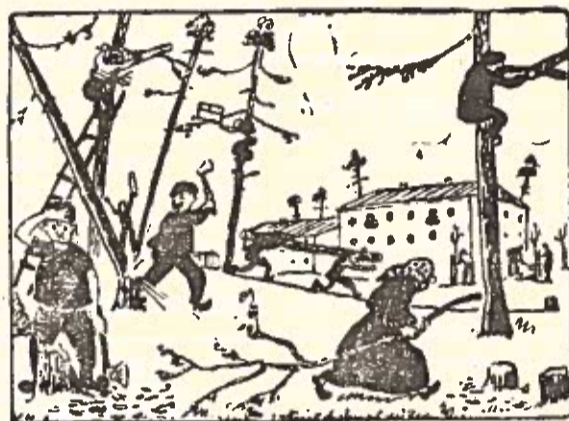
Kal niekas nieko nesako...

Rajone dar pasitaiko gamtos ir istorinių paminklų naikinimo faktų. Pavyzdžiui, Alksnių piliakalnyje iškirsta daug pušų. (Faktas).