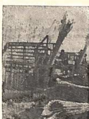
RUMUNIJOS LIAUDIES RESPUBLIKA. Meldų paruošimas statybai Dunojaus deitėje su kombaino pagalba. Ši met meldų surinkta du kartus daugiau negu praeitais metais.

Nuotraukoje: naujo traktoriaus surinkimas.