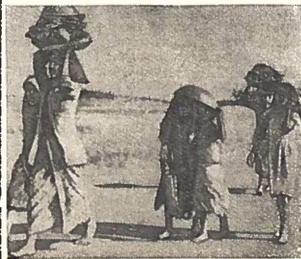
INDONEZIJOS RESPUBLIKA. Bali saloje. Grįžimas iš turgavietės.