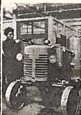
KINIJOS LIAUDIES RESPUBLIKA. Traktorių gamykla Lojano mieste (Chenanės provincija) išleido pirmuosius 20 šešiolikajėgių dujų generatorinių traktorių žemės ūkiui.

rių gamykla Lojano mieste (Chenanės provincija) išleido pirmuosius 20 šešiolikajėgių dujų generatorinių traktorių žemės ūkiui.