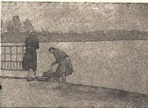
Dvi seselės žlugtą skalbė, Tikrai nedainavo: O kaip gėda šitaip teršti Ežerėlį savo!