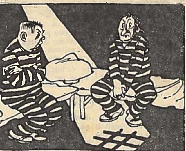
— Mane nuteisė trims metams. O tavo? — Pasisakyti per Bi-bi-si... E. Štegiro pieš.

miežiai, soros, kukurūzai. Varpinės žolės jautresni dygimo metu ir iki krūmėjimosi. Javai atsparesni krūmėjimosi metu. Preparato „2,4-D“ dozė iki 3—4 kg ir javams kenkia. Žinant įvairių augalų bei jų grupių reagavimą preparatui „2,4-D“, jį plniai galima panaudoti kovoje su piktžolėmis atskiruose pasėliuose. Patyrimas rodo, kad preparatas „2,4-D“ geriausiai rezultatus duoda grūdinių kultūrų pasėliuose. Krūmėjimosi metu panaudojus per 3 savaites žuva 70 proc. piktžolių. Likę auga silpnai ir javų nebenuostelbia. Nuo 1 kg preparato į ha plentių skaičius sumažėja 3 kartus, o masė iki 8 kartų.