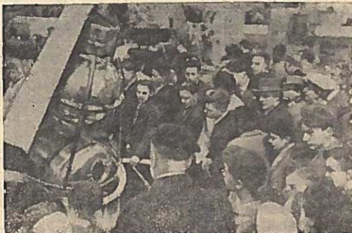
Pasaulinėje parodoje Briuselyje. Tarybų Sąjungos paviljone prie tarybinių dirbtinių Žemės palydovų po pranešimo apie trečiojo palydovo paleidimą.

Dviračiai su Šiaulių gamyklos ženklu laip pat pasiūsti į pramonės parodas Briuselyje, Damaske, Turkiijoje.