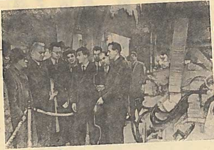
MASKVA. Visasajunginė pramonės paroda. Masinų statybos paviljonas. Čia neseniai atidaryta paroda, supažindinanti su kompleksine gamybinių procesų mechanizacija ir automatizacija. Nuotraukoje: parodos paviljone.