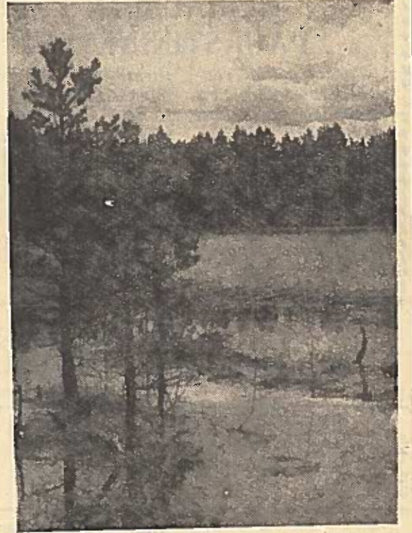
Pavasaris prie ežero.