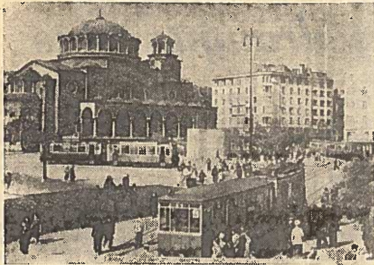
SOFIJA. Lenino aikštē.