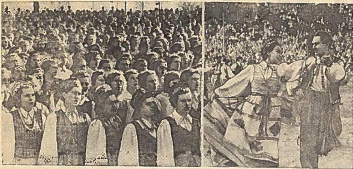
Praeitą šeštadienį Vilniuje, Kalnų parke, įvyko keičiantoj miesto dainų šventė, skirta Lietuvos KP sukūrimo ir proletarinės revoliucijos Lietuvoje 40-mečiui pažymėti. Nuotraukoje: vaizdai iš dainų šventės.