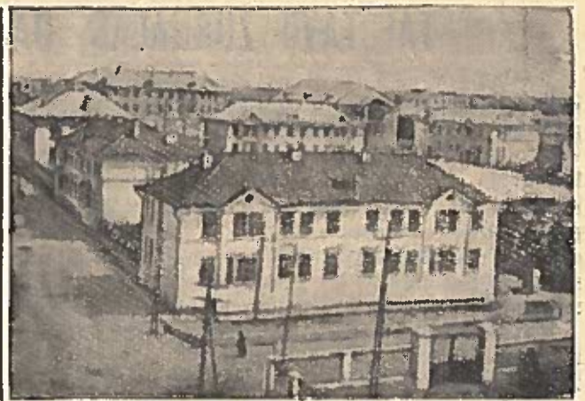
BAKU. Stepano Razino gyvenolė — viena iš gražiausių Apšerone. Čia gyvena naftos pramonės dūrbinkai. Gyvenolėje yra 5 mokyklos, 2 technikumai, technikos mokykla, dirba klubai, bibliotekos, vaikų sanatorija, liginė, 50 krautuvių ir ellė kitų kultūrinų-baitinų organizacijų. Tik per 1957 m. buvo atiduota eksploatacijon 38 namai. Dabar statoma daugiau 100 gyvenamųjų namų. Nuotraukoje: Stepano Razino gyvenolė.

Maskvoje jvyko du jūsu šaku gamybos tarptautiniai pasitarimai, kurie turi nepaprastai svarbiā reikšmē tolesniam ekonominiam socializmo šāļu vystymuisi ir visuotinēs taires bei tautų saugumo stiprinimui. Kalbama apie gegužēs 20—23d. d. jvykusį šāļu — Ekonominēs Savitarpio Pagalbos Tarybos dalyvių komunistų ir darbininkų partiju atstovų pasitarimą ir apie valstybių — Varšuvos sutarties dalyvių Politinio Konsultacinio Komiteto pasitarimą, jvykusį gegužēs 24 d. Šių pasitarimų medžiaga, išspausdinta centrinėje spaudoje, rodo socialistinų valstybių vienybēs stiprėjimą, jų nenuilstamą siekimą užtikrinti tolesnius savo vystymosi laimėjimus ir taikų visų šāļu sambūvį.