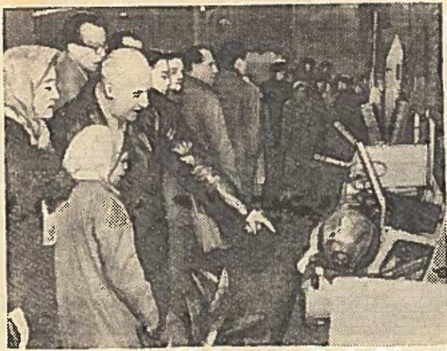
Pasaulinėje parodoje Briuselyje. Tarybų Sąjungos paviljone. Lankytojai apžiūri vidinę geofizinės raketos konteinerio, kuriame buvo patalpintas bandymui skirtas šuo, įrengimą.