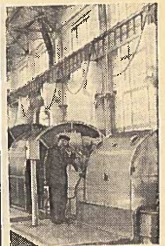
TULOS SRITIS. Šatsko elektros stotyje užbaigti čia pastatyti galingų dujų turbinų dviejų mazgų išbandymai. Nuotraukoje: aukšto slėgio dujų turbina.

Taisybų Sąjungos vyriausybė ne kartą įrodė ir įrodo savo kilnų stekimą apginti taikias lautas nuo imperialistų kėsintimosi, pašalinti karo galimybes. Tarybų Sąjunga su kitomis taikingomis valstybėmis padėjo didžiules pastangas agresyviam karui prieš Egiptą nutraukti. Dabar visi žino, kokį didelį indėlį į šį reikalą įnešė mūsų šalis. Tad kieno gi moralė stipresnė: ar Tarybų Sąjungos ateistų, kurie sustabdė šį karą, ar religijos kaukėmis besidangstančių imperialistų, kurie norėjo tęsti ir plėsti karą? kad tarybinė laudis vadovaujasi taikos stiprinimo interesais nepriklausomai nuo žmonių tikėjimo ir odos spalvos. Tuo metu, kai Tarybų Sąjungos vyriausybė reikalauja uždrausti atominį ir vandenilinį ginklą, imperialistinių šalių valstybių veikėjai, cituojantys biblijas, nori išsaugoti žudančią ginklą, griebsiasi įvairių diplomatinių sukybių su-trukdyti susitarimą dėl atominio ir vandenilinio ginklo uždraudimo, dėl taikos visame pasaulyje sustiprinimo. Argi visa tai nepriverčia kiekvieną giliai susimąstyti?