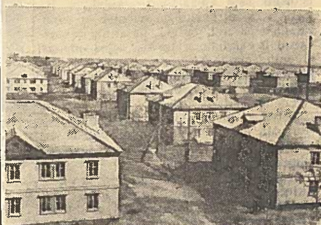
Pavlodaro statybų darbininkams statoma gyvenvietė. Per pirmą šiuo metų ketvirtį atiduota eksploatacijai virš trijų tūkstančių kvadratinį metrų gyvenamojo plotas. Nuotraukoje: bendras gyvenvietės vaizdas. Čia gyvena ir mūsų rajono komjaunimo pasuntiniai.