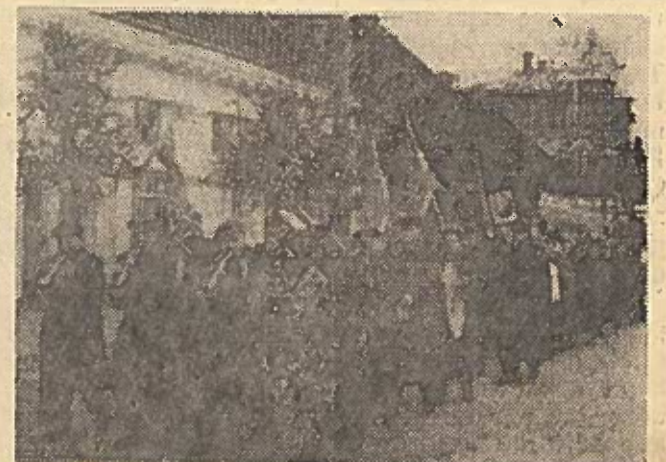
1958 metų Gegužės Pirmosios minėjimas Rokiškyje. Nuotraukoje (iš kairės į dešinę): I vidurinės mokyklos kolona. Vietinio ūkio valdybos dirbantieji demonstracijoje. Žyginėja „Nemuno“ fabriko darbininkai.