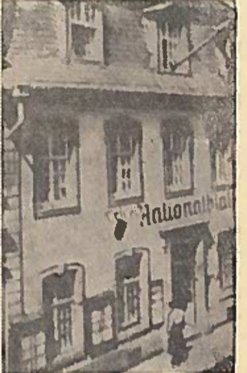
Namas Trire, kur gimė Karlas Marksa.