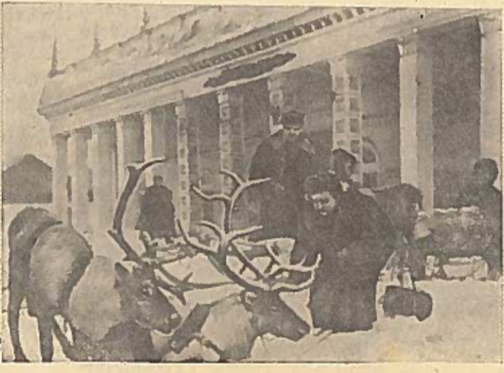
Nuotraukoje: prie Vorkutos valstybinio dramos teatro rūmų.

Vakarais poliarinio šachtininkų miesto Vorkutos gatvėse visuomet gyvas judėjimas. Visi skuba į klubus, kino teatrus, į svečius pas pažįstamą s. Gausu žmonių prie dramos teatro rūmų. Šiandien čia ispanų dramaturgo Aleksandro Kasonos pjesės „Medžiai miršta stovėdami“ premjera. Teatro įkūrimas glaudžiai susijęs su nauju pramoninio Komi ATSR miesto — Vorkutos gimimu.