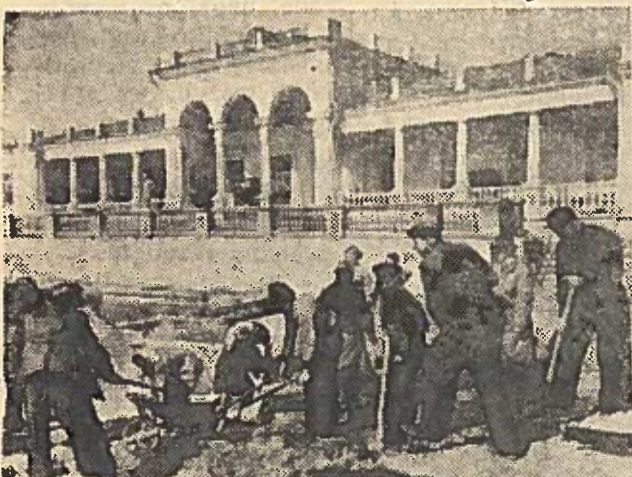
STALINGRADAS. Centrinėje miesto dalyje netoli „Dinamo“ stadiono statomas sportinis „Spartako“ draugijos atviras plaukymo baseinas. Jo statyboje dalyvauja sportininkai, vidurinių mokyklų vyresniū klasių, moksleiviai, studentai. Nuotraukoje: jaunimas darbo metu.