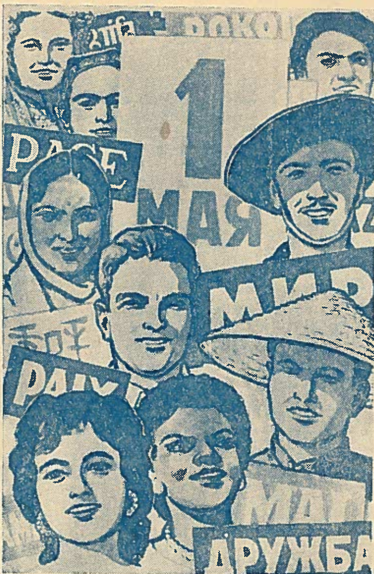
Dailininko A. Kokorekino darbo plakatas.

binos lubų skardą, atsirėmusią į tavo viršugalvį. Pašokinėji tuomet ant sėdynės spyruoklių kaip sviedinys ir