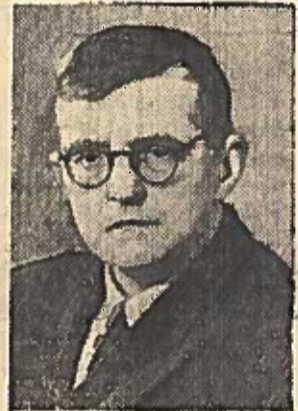
D. Sostakovičius — Lenino premijos laureatas. Premija suteikta už Vieniolikąją simfoniją „1905 metai“.

Lenino premija už mokslų darbus paskirta TSRS Mokslų akademijos atominės energijos instituto darbuotojams — akademikams L. Arclimovičiui, M. Leontovičiui ir kai kuriems mokslininkams bendradar-