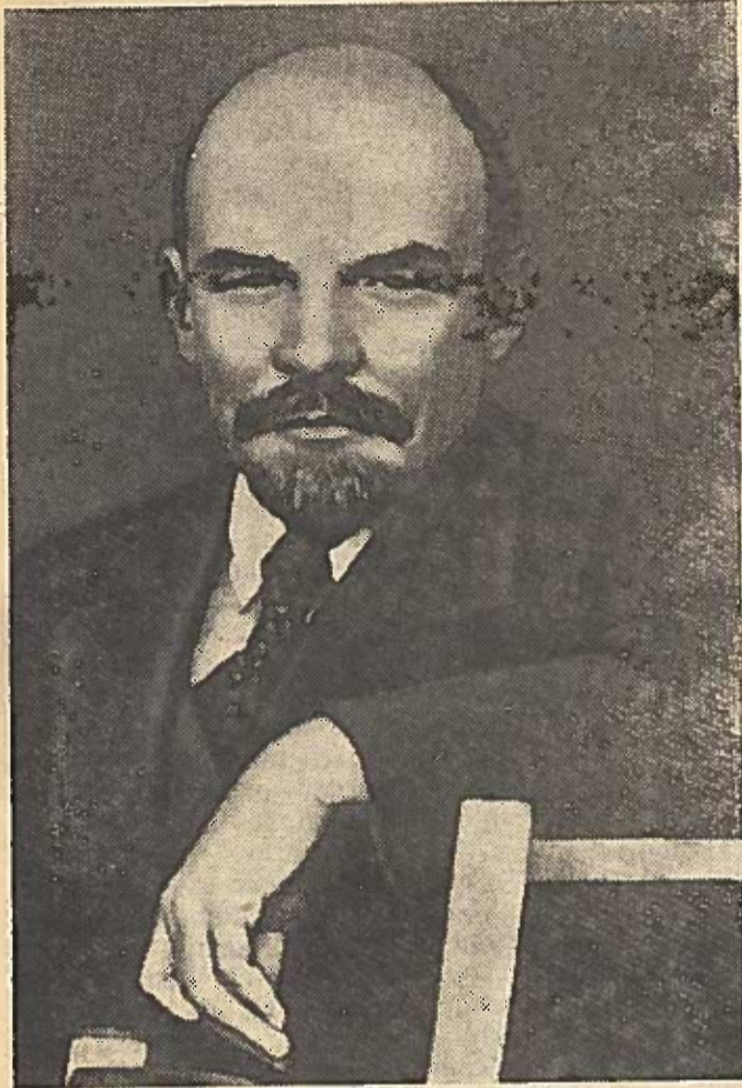
VLADIMIRAS ILJIČIUS LENINAS

Tarybinė liaudis bei viso pasaulio pažangioji žmonija garbina Vladimirą Iljičų Lenino 87-ąsias gimimo metines.