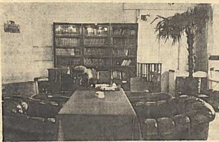
★ MASKVA, KREMLIUS.

Masės parėmė bolševikus, Lenina. Nenuilstamai teikdama apie save darbininkų klase ir varginguosius valstiečius, partija, žengdama Lenino nurodytu keliu, atvedė liaudį į pergalę Didžiosios Spalio socialistinės revoliucijos, kuri atvėrė naują pasaulį pasaulio istorijoje. (TASS-ELTA).