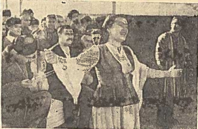
TADŽIKIJOS TSR. Pas Leninabado srities Nausko rajono kolūkiečius dažni svečiai būna rajono kultūrinė įstaigų darbuotojai. Pačiose tolimiausiose lauko stovyklose jie pasirodo su koncertais, skaito paskaitas, demonstruoja kinofilmus.

Nuotraukoje: Koncertas Satarovo vardo kolūkio lauko stovykloje.