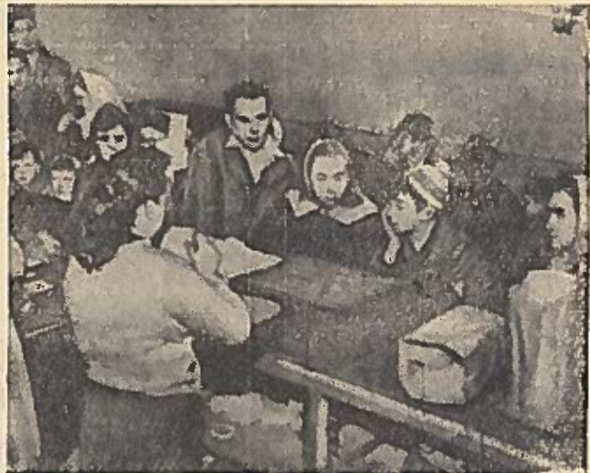
Dēl ekonominės padēties Jungtinėse Amerikos Valstijose. Meno valstija, Bidefordas, Skurstančiujų eilē punkte, kur išduoda produktus.