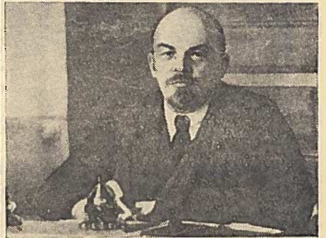
V. I. Leninas pirmame posėdyje po sužeidimo. 1918 metai.