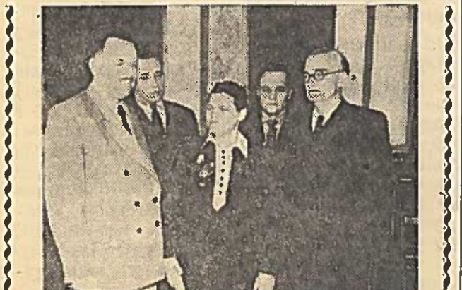
Būdami Vilniuje, daugelis respublikinio žemės ūkio pirmūnų pasitarimo dalyvių susitiko su mokslininkais, meno veikėjais, rašytojais.

Tuo pat metu bus suorganizuota tarprajoninė dailės paroda ir tarprajoninis gyvulių augintojų sąskrydis.