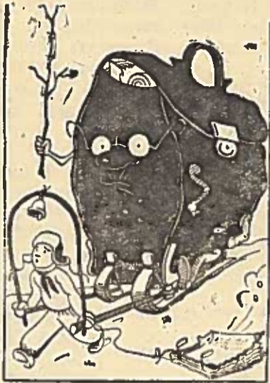
Krūvis ne pagal jėgas.

Kai kuriose rajono mokyklose mokiniai perkraunami visuomeniniu darbu, neturi laiko mokytis