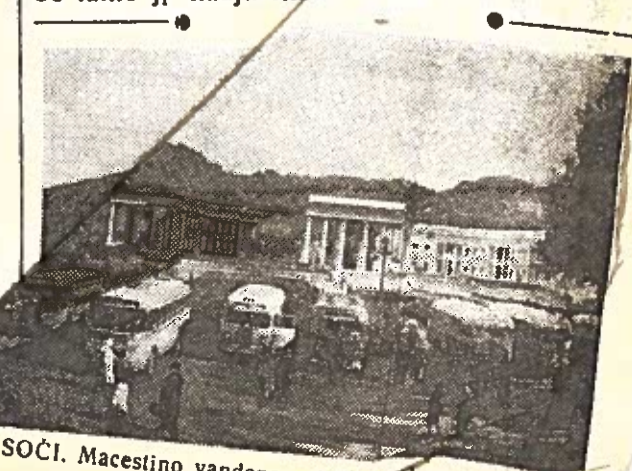
SOČI. Macesino vandens gydykla, korn. I. Grigoro.

Imdamosi šio žygio vienašališkai, iki sudarant bendrą nusiginklavimo susitarimą. Tarybų Sąjungos Vyriausybė laiko jį nauju rimtu žingsniu.