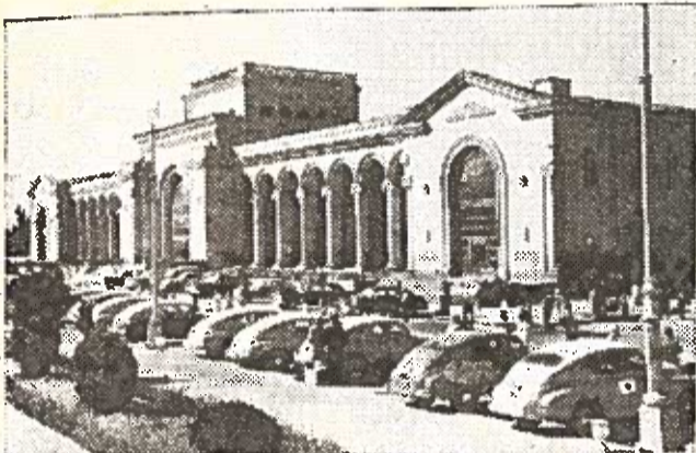
EREVANAS. Naujas geležinkelio stoties pastatas.