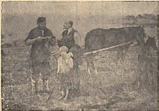
V. I. Lenino minėjimo dienai artėjant