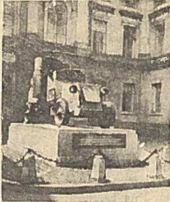
LENINGRADAS. Šarvuotis, pastatytas prie įėjimo į V. I. Lenino muziejų, 1917 m. balandžio 3(16) d. prie Suomijos stoties nuo šio šarvuotio nuskambėjo didysis V. I. Lenino šūkis: „Tegyvuoją socialistinė revoliucija!“

Partinėje srityje Balandžio tezėse buvo iškeltas reikalavimas nedelsiant sušaukti partijos suvažiavimą, pakeisti pasenusią programą ir partijos pavadinimą. V. I. Leninas pasiūlė Rusijos darbininkų klasės partiją pavadinti Komunistų partija, kaip vadino proletarinę partiją K. Marksas ir F. Engelsas. Toks pavadinimas atitiko galutinį partijos tikslą — komunistinės visuomenės sukūrimą.