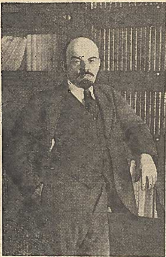
V. I. Leninas (1918 m.)

Nugalėjus Vasario buržuazinei - demokratinei revoliucijai šalyje susidarė dvi valdystės, susipynė dvi diktatūros — buržuazijos diktatūra, atstovaujama Laikinosios vyriausybės ir proletariato bei valstietijos diktatūra, kuriai atstovavo Darbininkų ir kareivių deputatų tarybos. Buržuazinė Laikinoji vyriausybė, remdamasi menševikų ir eserų parama, tuoj pat pabėgė kursą susiaurinti revoliuciją ir įvesti buržuazijos vienvaldystę.