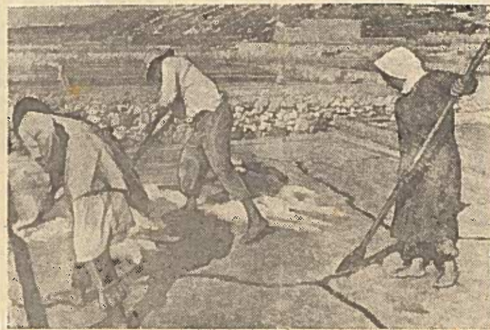
LIVANAS. Druskos verslovė netoli Tripolio miesto.