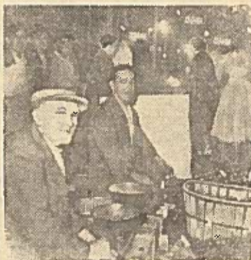
ISPANIJA. GRANADA. Daržovių prekiautojai vakare miesto gatvėje.