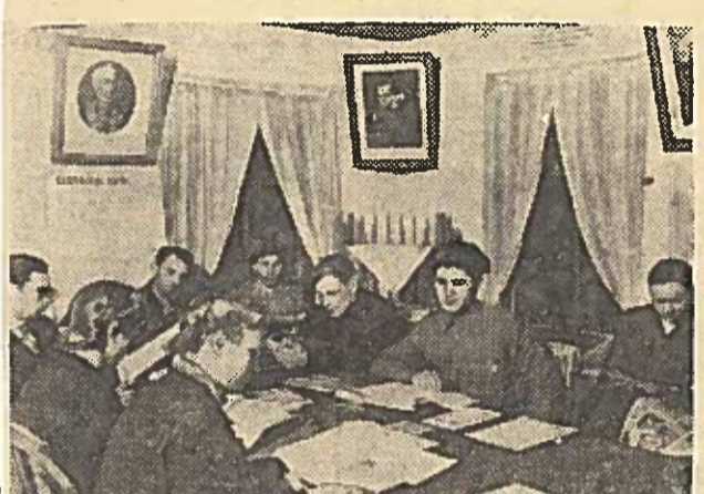
ALTAJAUS KRAŠTAS. Tretjakovo rajono Voroiilovo vardo kolūkyje yra gera biblioteka. Joje daugiau 4 tūkstančių knygų. Biblioteką nuolat lanko 500 žmonių. 8 kilnojamos bibliotekėlės aptarnauja artelės brigadas ir fermas. Nuotraukoje: Voroiilovo vardo kolūkio bibliotekos skaitykloje.