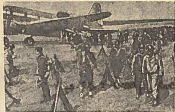
KUBA. Teroristinis diktatoriaus Batistos režimas laikosi išimtinai kariuomenēs pagalba. Nuotraukoje: vyriausybines kariuomenēs išaiptinimas pietinėje salos dalyje dėl susidorojimo su kubiečiais, kovojančiais prieš kruvinā Batistos tironijā.