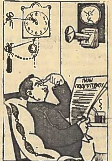
— Laikas palauks, o mes —