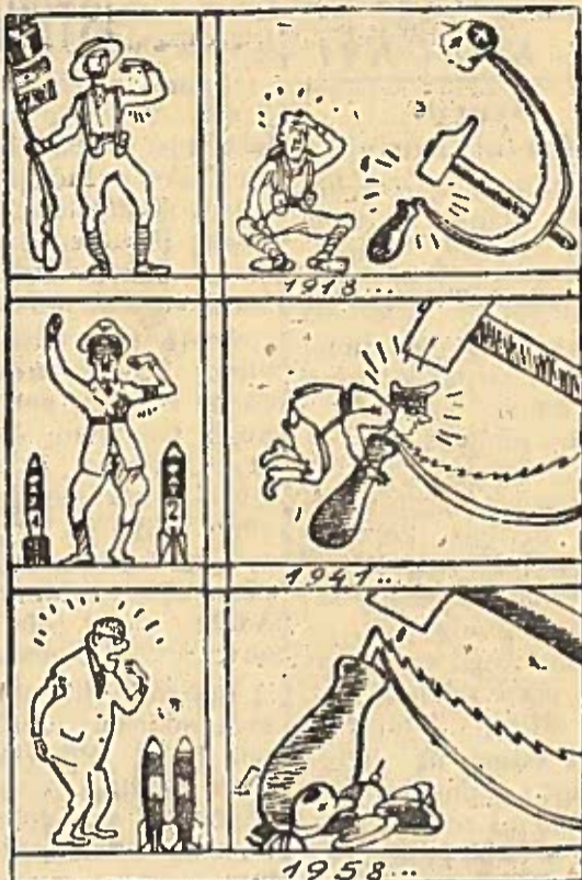
Tarybinės Armijos 40-ąsias metines pažymėjo ne tik TSRS tautos, bet ir visa pažangioji žmonija. Ši dailininko N. Mirčovo piešinį išspausdino Bulgarijos laikraštis „Rabotničesko delo“. Jis pavadintas trumpa kovos prieš komunizmą istorija.

pavojingiausių rajonų, kur betarpiškai priešais viena kitą yra valstybių — Šiaurės Atlanto bloko dalyvių ir Varšuvos sutarties dalyvių ginkluotosios pajėgos. Tarybinė vyriausybė yra tos nuomonės, kad kartu su atitinkamais „beatomine“ zonal priklausančių valstybių įsipareigojimai, kitos valstybės, turinčios branduolinį ir raketinį ginklą, privalo iškilmingai įsipareigoti gerbi nurodytos zonos slausą (tai yra nuostatus) ir laikyti