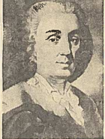
Karlo Galdoni, nuo kurio gimimo dienos vasario mėn. sukako 250 metų, buvo įžymus italų dramaturgas, realistiškos komedijos įkūrėjas, teatro reformatorius.

Karlo Galdoni yra parašęs daugiau kaip pustučio šimto pjesių, jų tarpe apie 150 komedijų. Jo kūryba buvo visai nauja epocha italų dramaturgijoje. Ligi tol italų teatre vyravo vadinamoji kaukių komedija.