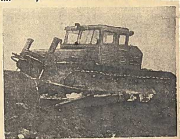
Čeliabinsko traktorių gamykla pagamino naują 250 arklio jėgų galingumo traktorių su elektrine transmisija.

Prie traktoriaus įtaisytas buldozeris su 6 metrų ilgio peiliu. Elektrinė transmisija įgalina automatišką greičio prijungimą, priklausomai nuo judėjimo sunkumo, palengvina traktoristo darbą ir padidina mašinos gamybinį pajėgumą. Traktorius turi patogią kabiną, iš kurios galima žiūrėti į visas puses, o taip pat apšildymą ir ventiliaciją. Buldozerio valdymas hidraulinis iš kabinos. Pirmieji traktoriaus su buldozeriu išbandymai davė gerus rezultatus.