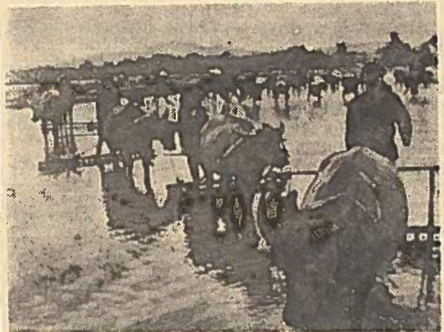
Vietnamo Demokratinėje Respublikoje agrarinės reformos rezultate likviduota feodalinė žemės valdymo sistema. Šalyje pradėtas žemės ūkio kooperavimo procesas. Demokratinė pertvarkymų pasekoje kaime įvyko staigus žemės ūkio produktų gamybos padidėjimas šalyje. 1956 m. bendras ryžių surinkimas viršijo prieškarinį lygį. Nuotraukoje: darbinės pagalbos brigada „Kai-Rong“ lauko darbuose.