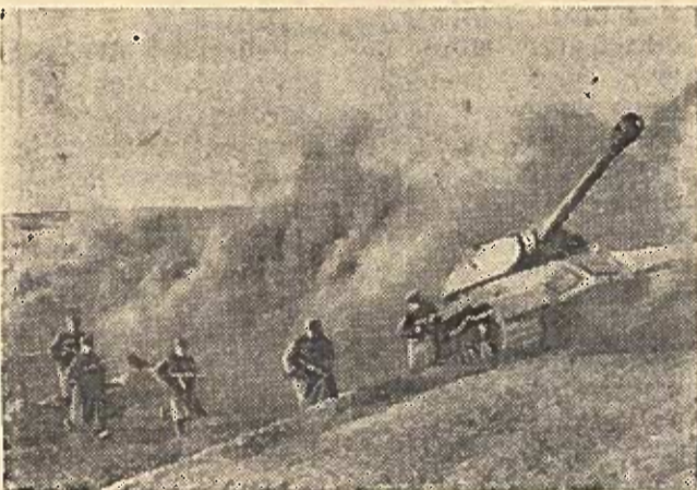
N. dalis taktiniuose užsiėmimuose.