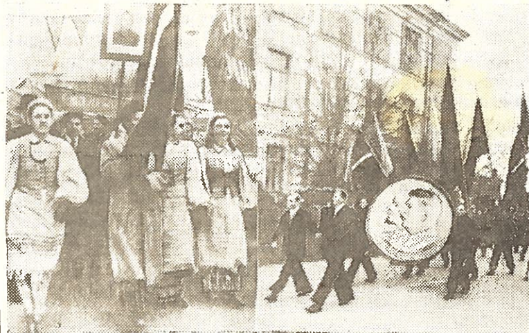
Didžiosios Spalio socialistinės revoliucijos 36-ųjų metų šventė. Nuotraukoje: Vilniaus darbo žmonių demonstracija.

Po pranešimo įvyko plati meninė dalis, kurią atliko Rokiškio kultūros namų ir vidurinių mokyklų saviveiklininkai. J. Meilus