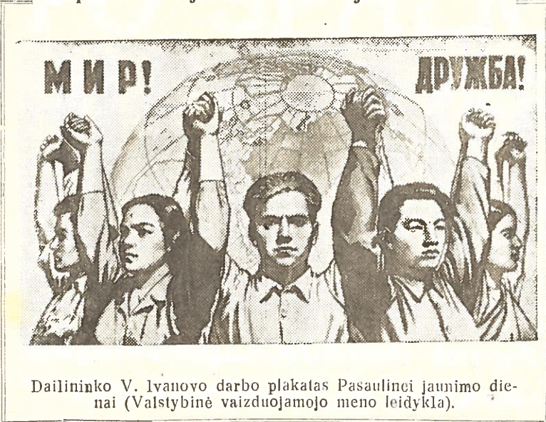
Dailininko V. Ivanovo darbo plakatas Pasaulinei jaunimo dienai (Valstybinė vaizduojamojo meno leidykla).