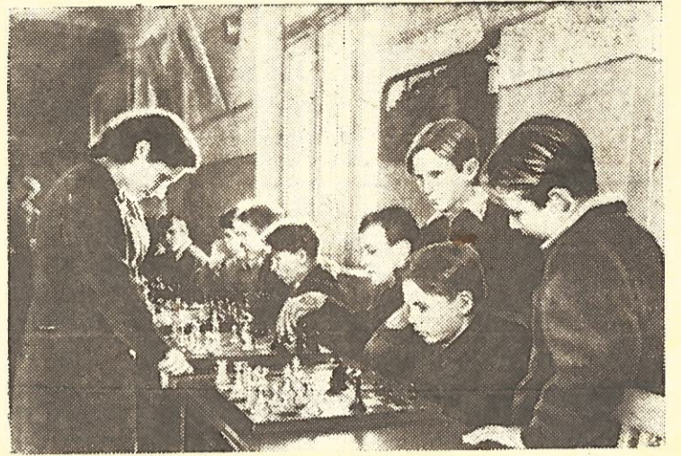
LENINGRADAS. Svečiuose pas Kirovo rajono Pionierių namų šachmatininkus pabuvojo šachmatų pasaulio čempionas moterų tarpe Jelizaveta Bykova. Ji davė seansą žaidimo 15 metų vienu metu. Po atkaklios dviejų valandų kovos J. Bykova laimėjo keturiolika partijų ir vieną baigė lygiomis. Nuotraukoje: J. Bykova svečiuose pas pionierius.