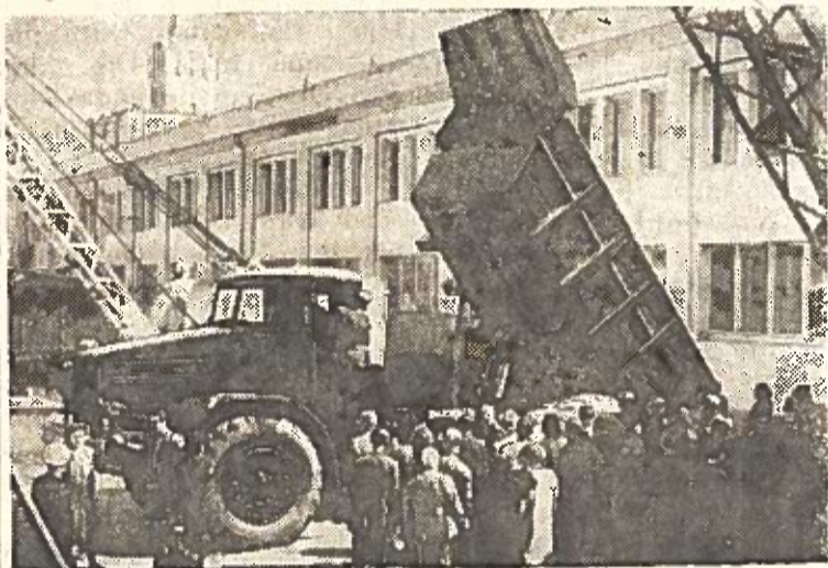
Rugpjūčio 30 — rugsėjo 9 d. d. Leipcige vyko tradicinė tarptautinė mugė. Nuotraukoje: mugės lankytojai apžiūri tarybinius sunkvežimius.