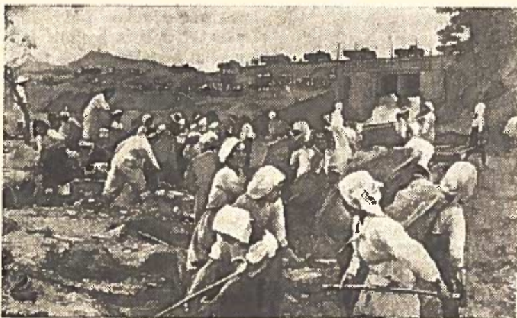
KORĖJOS LIAUDIES DEMOKRATINĖ RESPUBLIKA. Korėjos liaudies iškovojusi pergalę išlaisvinamajame Tėvynės kare, stoji į taikų darbą. Atstatomi miestai ir gyvenvietės, fabrikai ir gamyklos, vandens saugyklos, sugriauti amerikinių oro piratų. Nuoitraukoj: valstiečiai atstato Sunano vandens saugyklos užtvanką.