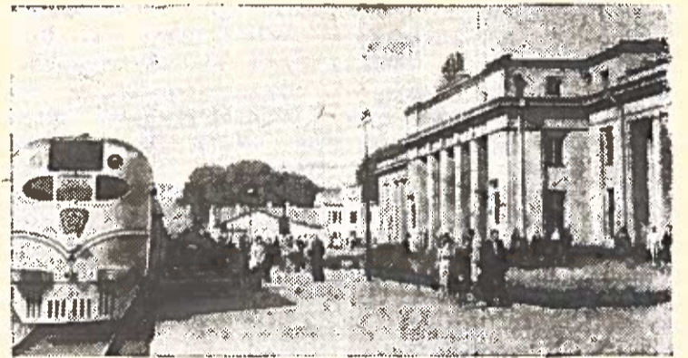
KAUNAS. Nauja geležinkelio stotis.

Fabrikas išleidžia dabar 13 procentų veltinių daugiau, negu praėjusiais metais.