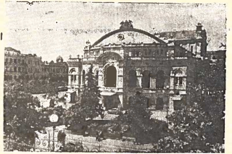
Kijiv. Ukrainos TSR valstybinis akademinis T. G. Ševčenkovo vardo operos ir baleto teatras.