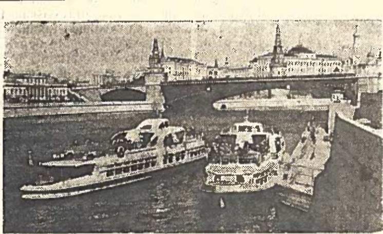
Maskva. Motorlaiviai „Moskvič“ prie prieplaukos „Bolšoi Kamenny Most“.