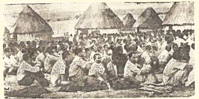
KENIJA (RYTŲ AFRIKA). Koncentracijos stovykla, kurioje laikomi anglų suimti negrai.