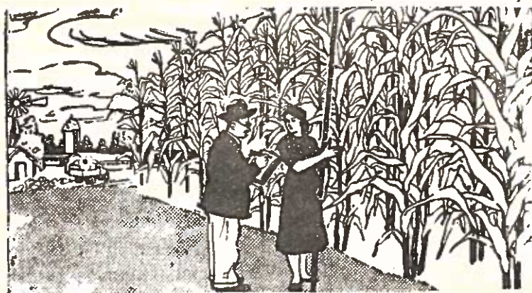
Aukštai rodikliai.

„Kukurūzų vertingumą sudaro tai, kad ši kultūra iš karto išsprendžia du uždavinius — papildo grūdų išteklius ir duoda iš kukurūzų stiebu gerą silosą.“ (N. S. Chruščiovas)