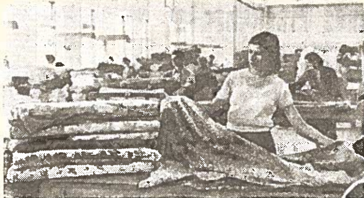
ALBANIJOS LIAUDIES RESPUBLIKA. TIRANA. Stambiausios tekstilės pramonės įmonės — Stalino vardo kombinato kolektyvas kovoja už išleidžiamosios produkcijos pagerinimą. Visi gaminiai, išleidžiami kombinato, griežtai tikrinami. Nuotraukoje: produkcijos kokybės tikrinimas.