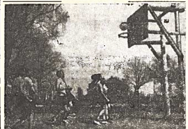
KAMAJAI. Neseniai čia susitiko Rokiškio III ir vietos vidurinių mokyklų krepšinininkai. Susitikimą laimėjo rokiškietis. Nuotraukoje: momentas iš rungtynių.