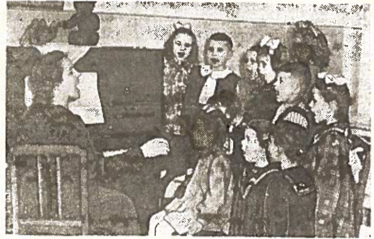
Nesenai Kaune atidarytas naujas vaikų darželis „Pergalės“ turbinų gamyklos darbininkų ir tarnautojų vaikams. Jame įrengti šviestis, jaukūs miegamieji, salė, žaidimų kambariai ir kt. Nuotraukoje: naujame darželyje. Vaikai mokosi dainos.