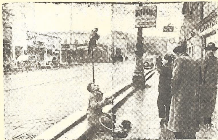
Vienos gatvėse (Austrija) dažnai sutinkami slankiojantieji muzikantai, lyrininkai, juokdariai. Tai — bedarbiai, pasiruošę imtis bet kokio amato, kad tik užsidirbtų kąsni duonos.

Šalyje, kur gyvena daugiau kaip 21 milijonas žmonių, gydytojų skaičius vos viršija 8 tūkstančius, o medicinos seserų yra iš viso 400. Moterys Turkijoje visiškai nežino, kas yra medicininė pagalba gimdymams. Skurdas toks didelis, kad net ir miestuose motinos yra priverstos vystyti naujagimius į laukraščius. Vaikų mirtingumas siekia katastrofinį mastą. 1951 metais Turkijoje iš 800