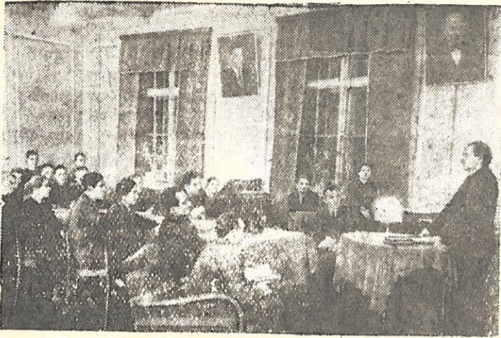
CHARKOVAS. Virš 100 darbininkų ir tarnautojų lanko vakarinę literatūros ir meno universitetą, įkurtą prie geležinkelininkų Stalino vardo Kultūros rūmų.

N u o t r a u k o j e: klausytojai paskaitoje.